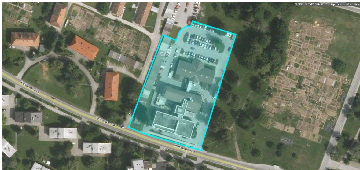
Slika 9-2: Mikrolokacija Zdravstvenega doma Slovenska Bistrica

Zdravstveni dom Slovenska Bistrica je lociran na parcelni številki 700 v k.o. Slovenska Bistrica, v naselju Slovenska Bistrica, Partizanska ulica 30.